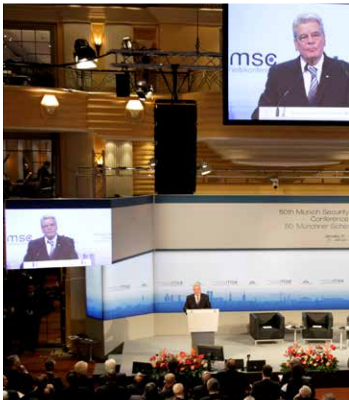
Joachim Gauck spricht auf der Münchner Sicherheitskonferenz

machen, dass Deutschland sich nicht dauerhaft auf den Kurs des Raushaltens um jeden Preis festlegt, für den der Außenminister steht.“ 11