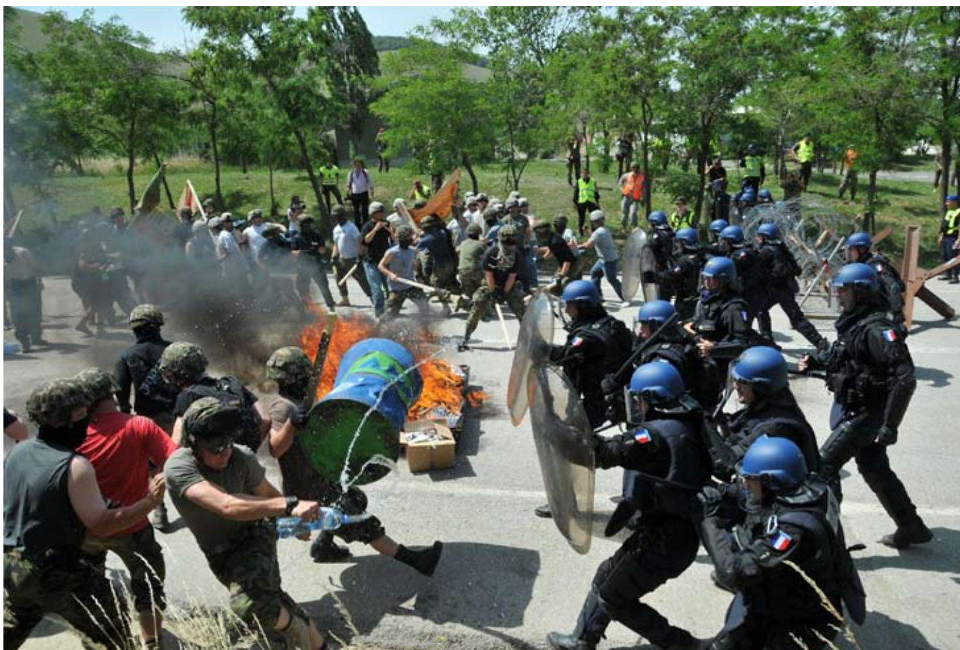
NATO-EU-Übung zur Aufstandsbekämpfung im Kosovo.

Obwohl der Kosovo sich Anfang 2008 formal für unabhängig erklärt hat, steht er weiter unter internationaler Überwachung – und zwar solange, bis ihm die westlichen Besatzer die „Europatauglichkeit“ attestiert haben. Die Fremdherrschaft wird also fort dauern, bis