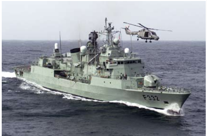
Foto: Kriegsschiff der EU-Operation ATALANTA

Ein aktuelles Beispiel, wie die Kausalkette zwischen neoliberalen „Reformen“, Verarmung der Bevölkerung, gewaltsamen Konflikten und westlichen Militärinterventionen funktioniert, ist die Pirateriebekämpfung am Horn von Afrika. Als Somalia in den 80er Jahren in die Schuldenkrise geriet und durch Strukturanpassungsprogramme des IWF zur Übernahme neoliberaler Politiken gezwungen wurde, brach der Staat in der Folge zusammen. Staatsangestellte konnten nicht mehr entlohnt werden, weshalb u.a. die Küstenwache entlassen wurde. Dies hatte zur Folge, dass europäische Fischfangflotten die Region leerfischten und den somalischen Fischern die Lebensgrundlage entzogen. Aus diesen zwei Gruppen – ehemalige Angestellte der Küstenwache und verarmte Fischer – setzt sich ein Großteil der nun in den Blick der Öffentlichkeit geratenen Piraten zusammen, die am Horn von Afrika Schiffe aufbringen (und damit aus NATO-Sicht den freien Warenverkehr gefährden). Anstatt aber die Ursachen des Phänomens anzugehen, entsendeten NATO (Operation Ocean Shield) und die Europäische Union (Operation ATALANTA) Kriegsschiffe in die Region, um das Problem wortwörtlich zu bekämpfen.