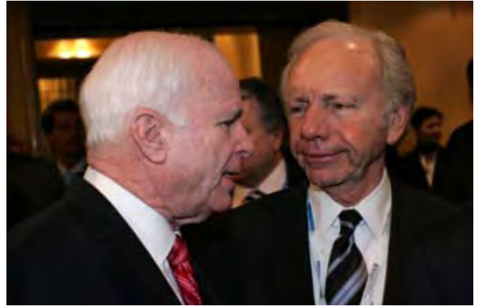
„Joseph Lieberman und John McCain: Kriegsdrohungen gegen den Iran“

Dennoch folgte dem Auftritt des iranischen Außenministers von westlicher Seite ein Sturm der Entrüstung, verbunden mit unverhohlenen Drohgebärden in Richtung Teheran. Deshalb ist es erforderlich, sich das „großzügige Angebot“, das – glaubt man Politikern und Medien – der Iran nun so rotzfroh ausgeschlagen habe, etwas näher zu betrachten. Wie bereits erwähnt, ist die Urananreicherung – unabhängig davon, wie man persönlich