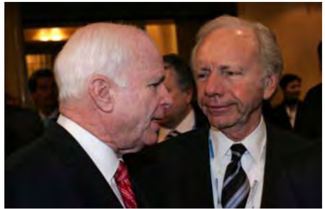
„Joseph Lieberman und John McCain: Kriegsdrohungen gegen den Iran“

Dennoch folgte dem Auftritt des iranischen Außenministers von westlicher Seite ein Sturm der Entrüstung, verbunden mit unverhohlenen Drohgebärden in Richtung Teheran. Deshalb ist es erforderlich, sich das „großzügige Angebot“, das – glaubt man Politikern und Medien – der Iran nun so rotzfroh ausgeschlagen habe, etwas näher zu betrachten. Wie bereits erwähnt, ist die Urananreicherung – unabhängig davon, wie man persönlich