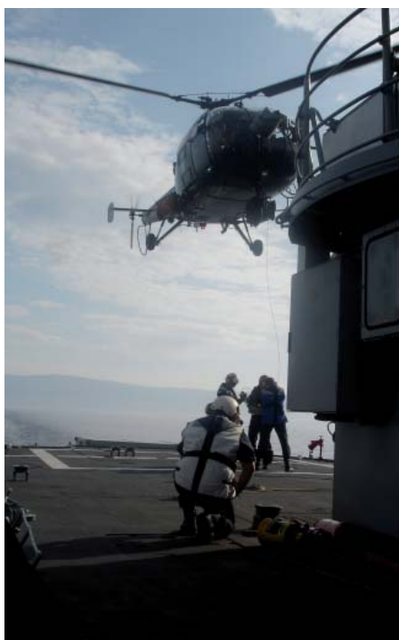
Beim NATO-Manöver Noble Midas 2007 wurde ein neuerlicher Krieg gegen Serbien geprobt.

Gegenwärtig ist vollkommen unklar, wie Serbien auf einen solchen Schritt reagieren würde. Sicher ist jedoch, dass Belgrad einen derart drastischen Eingriff in sein Souverä-