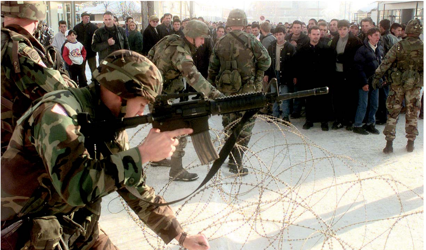
KFOR „Riot Control“ gegen albanische Demonstranten

Charakter des Ahtisaari-Plans und die neoliberale Zurichtung durch die westlichen Staaten ebenfalls auf immer größeren Widerstand trifft, bereiten sich die Europäische Union und die NATO derzeit paradoxerweise auf bewaffnete Auseinandersetzungen mit beiden Konfliktparteien vor.