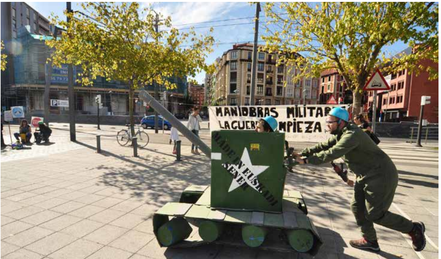
Mit einem selbstgemachten Panzer informieren und protestieren Kriegsgegner_innen in Bilbao.

Die Koordinierungsgruppe plant für den 31. Oktober eine regionale Demonstration in Marsala, um gegen die von Sardinien auf Sizilien verlegten Manöver zu protestieren.