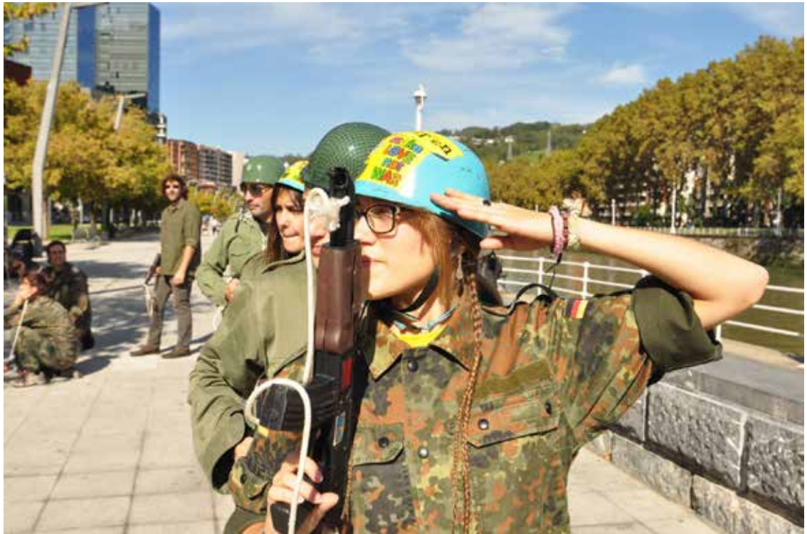
Als Soldat_innen verkleidete Antimilitarist_innen in Bilbao protestieren mit Straßentheater gegen die NATO.

Aufstockung der bisherigen schnellen Eingreiftruppen NATO Response Force von 13.000 auf 40.000 Kräfte und die Schaffung der neuen aus 5.000 Soldat_innen bestehenden Very High Readiness Joint Task Force (VJTF), welche innerhalb von 48 Stunden verlegt werden kann. Diese VJTF, welche auch „Speerspitze“ genannt wird, soll durch TRJE15 getestet[20] und offiziell 2016 eingeführt werden. Zudem wurden auf dem NATO-Gipfeltreffen in Wales[21] sechs Maßnahmen zur Stützung der Connected Forces Initiative (CFI) beschlossen, welche die Interoperabilität der Streitkräfte aus den verschiedenen Mitgliedsstaaten stärken soll. Eine dieser Maßnahmen ist die Großübung TRJE15 und die Entwicklung eines „breiteren und herausfordernden“[22] Manöverprogramm für das kommende Jahr 2016. Der deutsche General Hans-Lothar Domröse[23] – Leiter der TRJE-Übung und Oberbefehlshaber des Allied Joint Force Command Brunsum – beschrieb die aktuelle Entwicklung der NATO mit folgenden Worten von Winston Churchill: „Dies ist nicht das Ende. Es ist auch nicht der Anfang des Endes. Es ist vielleicht das Ende des Anfangs.“