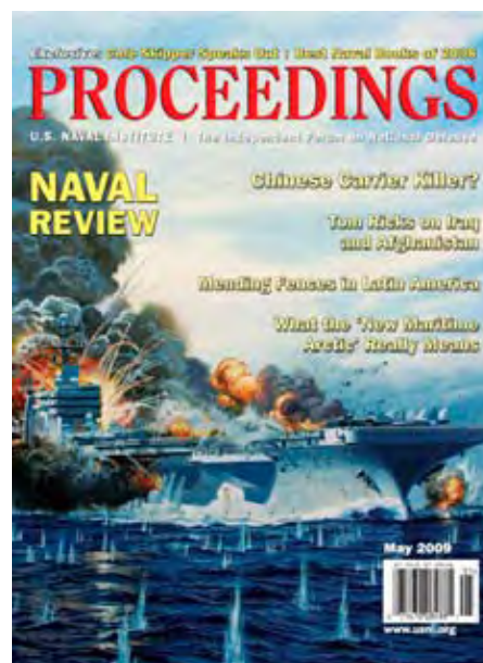
Cover Proceedings Magazin, Mai 2009

Die Umgestaltung des Militärisch-Industriellen-Komplexes seit den 1980er Jahren hatte die chinesischen Waffenproduzenten anfangs in die unvorteilhafte Lage gebracht, dass nicht einmal die chinesische Armee und Marine mehr ihre Produkte haben wollte. Heute, einige Konzentrationswellen später, ist die Waffenindustrie insgesamt, aber auch der Schiffsbau im Besonderen, in der Lage, anspruchsvolle Produkte zu entwickeln. Die effektive Integration von Entwicklung,