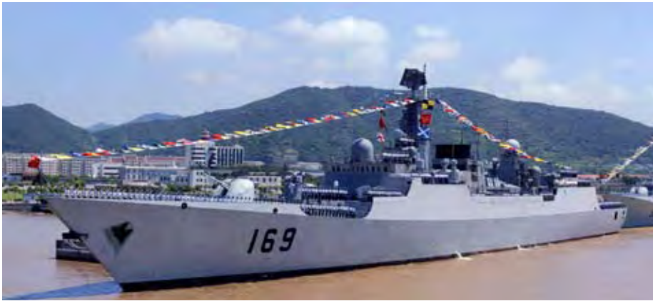
Vor Somalia auf „Piratenjagd“: Zerstörer Wuhhan

Deutlich für beide Fälle ist jedoch geworden, dass die ökonomische Dimension, die sich auf die Ausnutzung von Bodenschätzen und das Aufrechterhalten von Transit-routen für die Handelsschifffahrt bezieht, ergänzt wird durch eine militärisch-strategische, die niedrig zu halten das eigentlich Ziel sein sollte. Die Rechtfertigung des chinesischen Flottenausbaus als „Normalität“ und als „Angemessen für die Größe Chinas“ sollte nicht darüber hinwegtäuschen, dass sie ein Schritt in die Richtung sind, eigene Interessen durchaus auch mithilfe militärischer Gewalt durchzusetzen. Japan, so ist an den Anschaffungen für die Selbstverteidigungskräfte abzulesen, sieht sich hier in der Pflicht, auf die chinesische Rüstung zu reagieren, wohl wissend, dass damit das Konfliktpotential mit der VR China nicht kleiner wird.