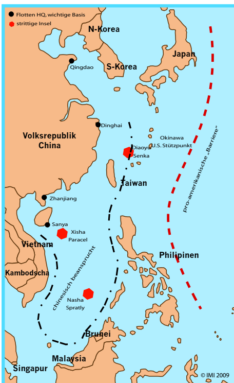
Strittige Ansprüche im Meer um China -

Der Wille zur Projektion militärischer Stärke zeigt sich auch daran, dass Indien