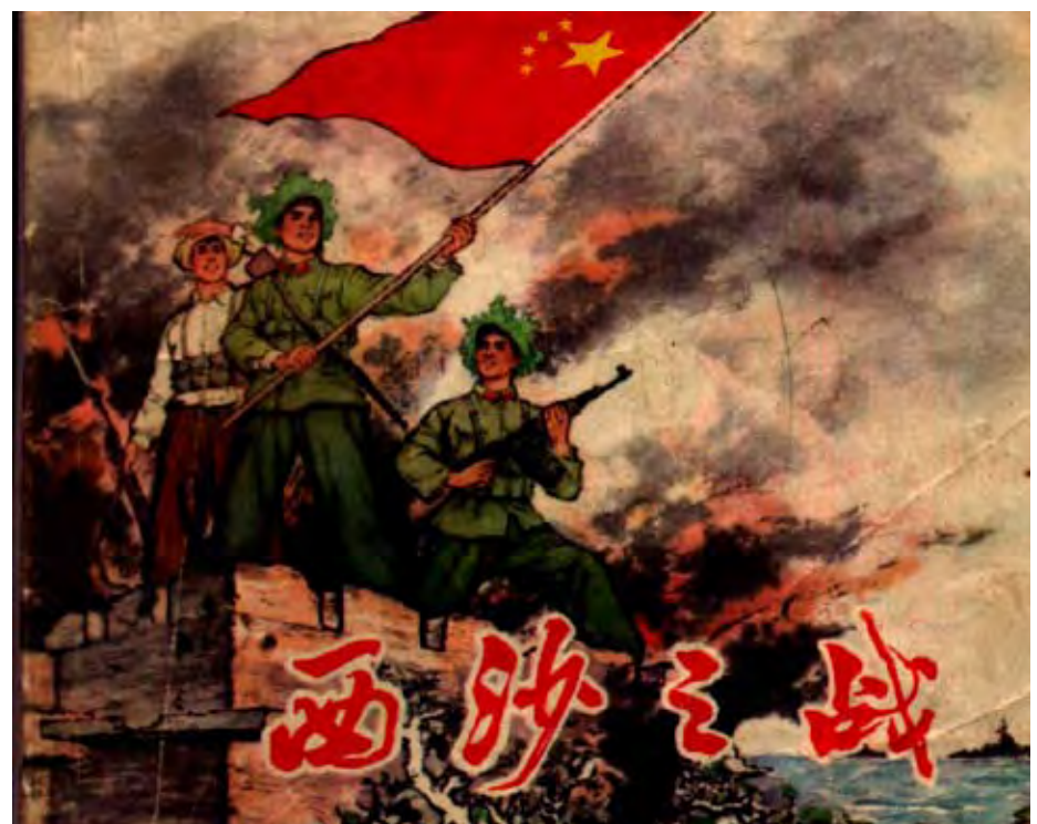
Propagandacomix anlässlich der Einnahme von Xisha/Paracel durch die Chinesen 1974