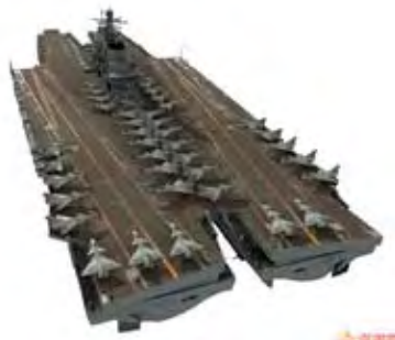
Visionen der chinesischen Internetgemeinde: Flugzeugträger

Trotz all dieser Bemühungen gibt es immer noch eine Reihe von Schwachstellen, die sich auch in einem Zeitrahmen von 10 Jahren sicher nicht beheben lassen. So